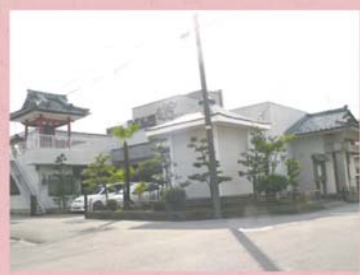
①⑧ 無量寺 (八重巻東町)