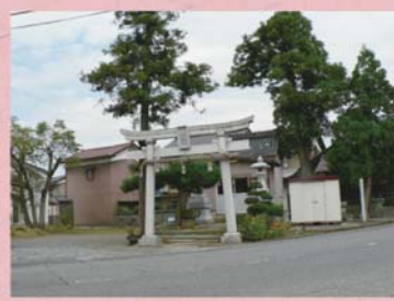
②⑤ 八坂神社 (定正町)