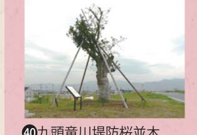
④⑨ 九頭竜川堤防桜並木 (上野本町)