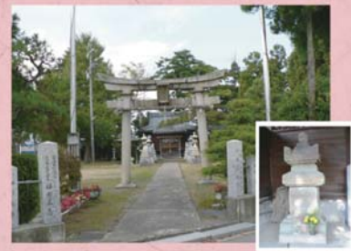
① 日吉神社 (天池町) ② 石塔