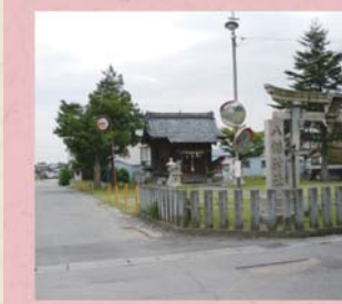
④⑥ 八幡神社 (栗森町)

詳細については、CD-ROM (公民館で閲覧可)・インターネット等でもご覧いただけます。 URL: http://waiwai.map.yahoo.co.jp/