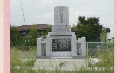
③⑥ 学童罹災慰霊碑 (石盛町)