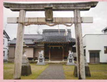
①① 日吉神社 (稲多浜町)