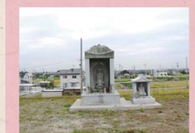
③⑨ 鮎地蔵 (上野本町)