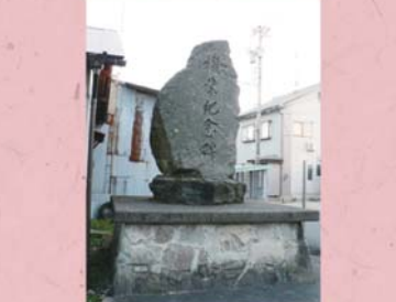
①③ 機業記念碑 (古市)