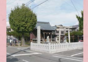
②③ 白山神社 (下森田藤巻町)