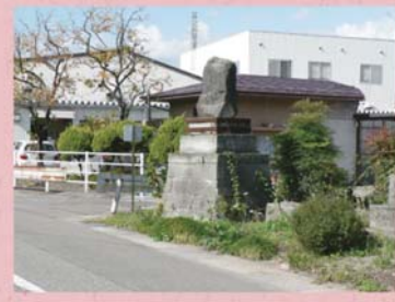
⑳ 算塚 (上森田町)