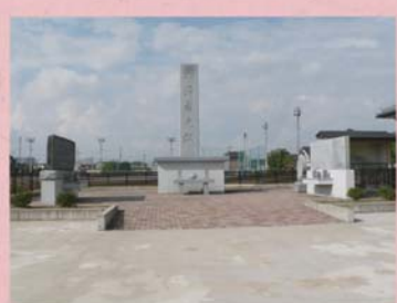
②④ 戦没者之塔 (下森田新町)