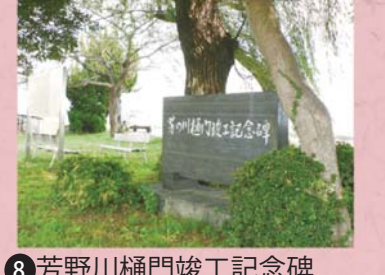
⑧ 芳野川樋門竣工記念碑 (稲多元町)