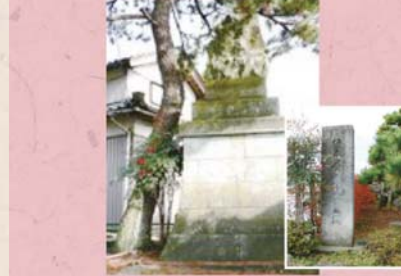
⑳ 橋本岩太郎先生の碑 (石盛町)