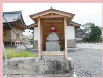
③③ 人橋地蔵尊 (石盛町)