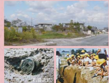
③② 石丸城址 (石盛町)