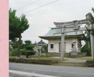
④④ 上野神社 (上野本町)