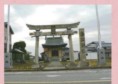
⑤⑩ 春日神社 (漆原町)