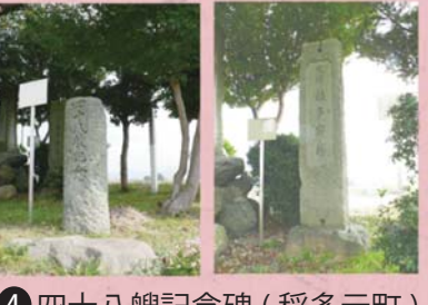
④ 四十八艘記念碑 (稲多元町) ⑤ 稲多宿場記念碑 (稲多元町)