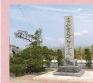
④⑤ 高松宮殿下記念碑 (上野本町)