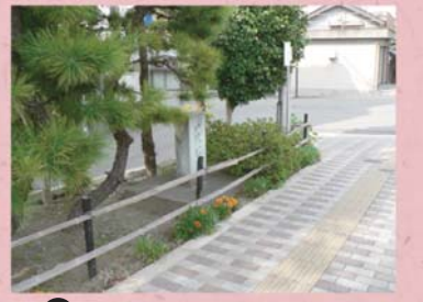
③ 一里塚碑 (稲多新町)