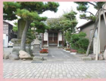
⑳ 森田震災観音堂 (栄町)