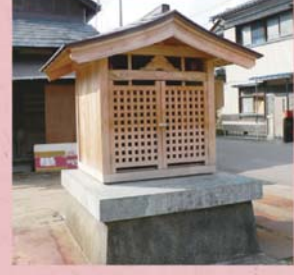
②② 下森田地蔵尊 (下森田藤巻町)