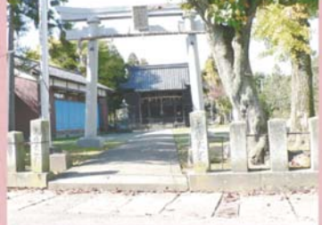
③① 白山住吉神社 (上森田町)