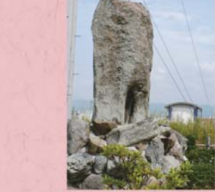
④② 早瀬正二君の碑 (上野本町)