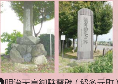
⑥ 明治天皇御駐輦碑 (稲多元町) ⑦ 架橋記念碑 (稲多元町)