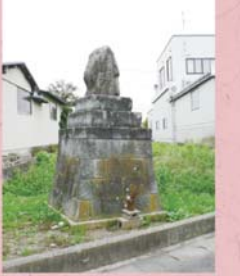
④⑦ 謡塚 (栗森町)