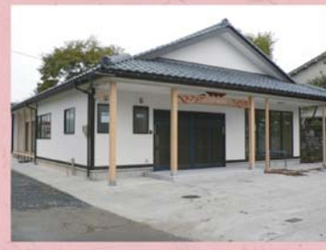
⑩ 香雲寺 (稲多新町)