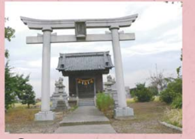
④⑧ 神明神社 (河合寄安町)