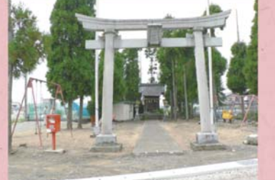
④⑨ 白山神社 (森田新保町)