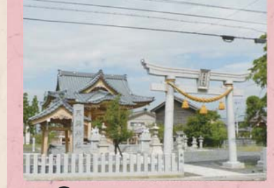
③⑤ 天満神社 (石盛町)