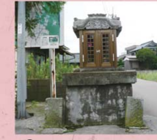
④③ 上野地蔵尊 (上野本町)