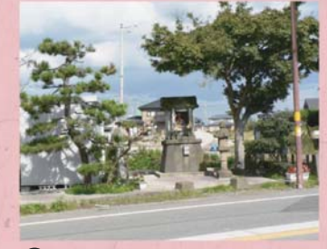
③⑩ 延命地蔵尊 (上森田町)