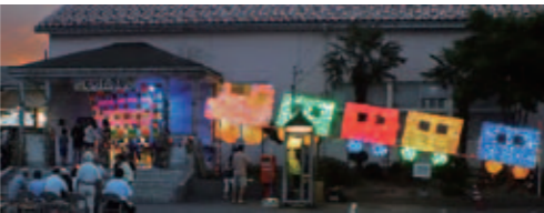
もりた夢駅 夏・冬 駅舎を彩るイルミネーション