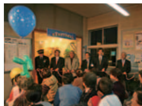
2011年 夢ギャラリー森田開設