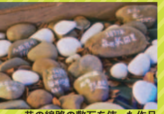
昔の線路の敷石を使った作品