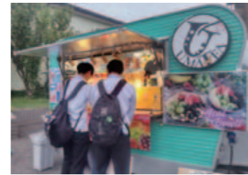
スイーツのキッチンカー

令和6年度は、2月末までで8組の応募があり、のべ59回の出店がありました。最初の頃は、この企画があまり知られていないため、駅利用者や近所の人からの苦情もありましたが、回数を重ねていくうちに、この企画の目的が理解され、出店を楽しみにして下さる人が増えてきました。