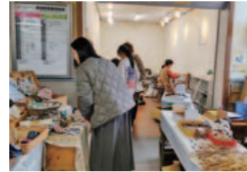
小物作りのワークショップ