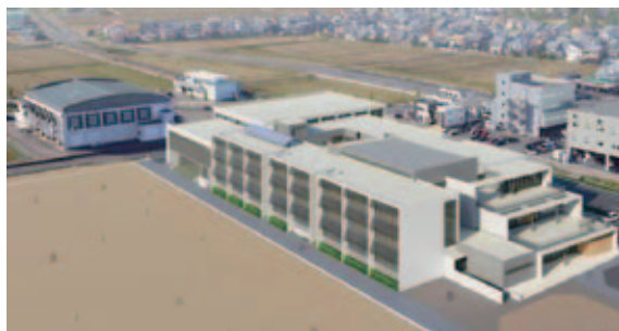
九頭竜中学校鳥瞰図