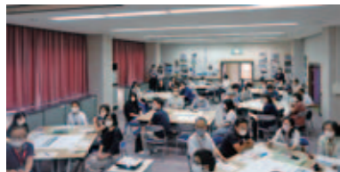
2022年 森田駅活用ワークショップ