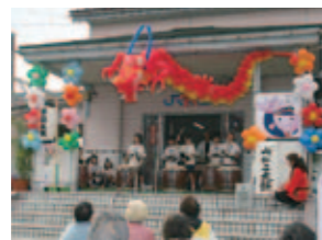
2010年 もりた夢駅 夏・冬 多くの方々が来場