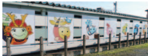
2017年 仁短生がデザインしたもりたんファミリー